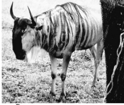
ধু — ফ্রি সফটওয়্যার ফাউন্ডেশনের ছবিতে এবং জঙ্গলে

১৯৭৭।। সাতাত্তরে এল বিএসডি প্রথম ভার্শন। এর সঙ্গে ছিল ওই এক্স এডিটর এবং পাস্কাল বলে একটা কম্পিউটার ভাষার বার্কলে সংস্করণ। এর জন্যে মোট দাম ধার্য ছিল কুড়ি ডলার। এই কুড়ি সংখ্যাটাকে মনে রাখুন, এখুনি আমাদের তুলনা করতে কাজে লাগবে। আর দুতিন বছরের মধ্যেই, শুধু যে এই দামটাই বীভৎস ভাবে বদলে যাবে তা নয়, এর সঙ্গে চালু হবে লাইসেন্সিং নিয়ে উন্মত্ত কড়াকাড়ি। এই সময় অর্ধ আবহাওয়াটা অনেকটাই বিদ্যাচর্চার, দাম যা নেওয়া হচ্ছে সেটাও নূনতম যতটুকু প্রয়োজনীয়। এর পরেই আবহাওয়াটা চলে যাবে একচেটিয়া পুঁজির মুনাফাবাজিতে। আর সফটওয়্যারের উপরেও আসবে বাধানিষেধ। যাতে একটা যুগের প্রোগ্রামারদের কাজের উত্তরাধিকার পরের যুগে আর পৌঁছবে না, পুঁজি তাকে আটকে দেবে। তার মুনাফার স্বার্থে। এতকাল অর্ধ মানুষের বিদ্যাচর্চার বিকাশটা ছিল সামগ্রিক, প্রতিটা প্রজন্ম যা করত সেটা পেয়ে যেত পরের প্রজন্ম। সেই বিবর্তন প্রবাহটাকে আটকে দেওয়া হবে। আর সেই আটকে দেওয়াটার প্রভাব আর শুধু কম্পিউটারেই সীমাবদ্ধ থাকবে না, কারণ, আর মাত্র একটা দশকের মধ্যে এমন সময় চলে আসছে যেখানে বিদ্যাচর্চার প্রতিটি এলাকারই জীবনকাঠি আসলে থাকবে কম্পিউটারের মধ্যে।