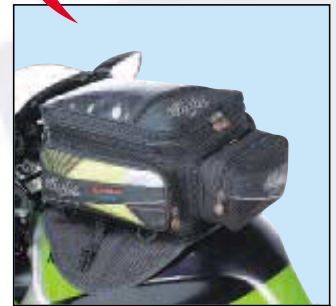
SAC PRINCIPAL EXTENSIBLE