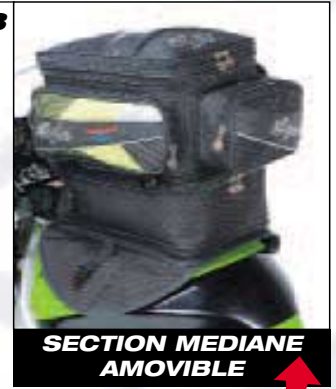
SECTION MEDIANE AMOVIBLE