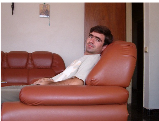
A la maison

je vis loin du confort moderne se rassurent, l'appartement est grand et bien équipé. Nous avons un frigidaire, téléphone, télévision (autrement on ne pourrait pas voir le mondial 2006 !), et même un générateur ! Il a toutefois fallu renoncer à certains aspects du confort auquel j'étais habitué : par exemple, il faut faire bouillir l'eau (et la laisser refroidir) avant de pouvoir la boire, je me douche avec de l'eau froide, nous avons régulièrement des coupures d'électricité. Pourtant,