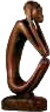
Le Penseur Angolais

Portugal (Caldas da Rainha, ma ville natale !!!), de "John Bull" en Angleterre ou de l'"oncle SAM" aux Etats-Unis -, le "Pensador" a son origine dans "une tradition inventée" - comme Hobsbawm indiquerait – ou "stipulerait". En vérité, les premiers penseurs angolais avaient été sculptés dans les ateliers du musée du Dundo après 1947. Cette année là, à l'initiative du Diamang, puis de la compagnie des diamants du Lunda, a été créée dans la province du Dundo un musée d'art et ethnographie traditionnels et des collections archéologiques. Les employés du Diamang, des Belges et des Portugais, sont arrivés pour engager les artisans locaux et les ont installés dans des ateliers, les ayant stimulés à sculpter dans le bois ou en terre cuite qui étaient matériaux