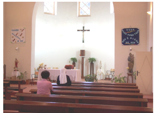
La Chapelle où se célèbrent les messes.

Les autres activités n'ont pas beaucoup évolué depuis le dernier rapport. Il y a toujours la messe de 17h30, qui n'a pas beaucoup de participation. Je n'ai pas encore eu l'occasion d'organiser d'autres activités avec les étudiants. En réalité, ce qui rend le travail difficile, c'est le fait de ne pas pouvoir être partout en même temps. Mais je crois qu'avec la nouvelle Association des Étudiants de l'Université qui est en train d'être constituée, de nouveaux projets pourront surgir, pour