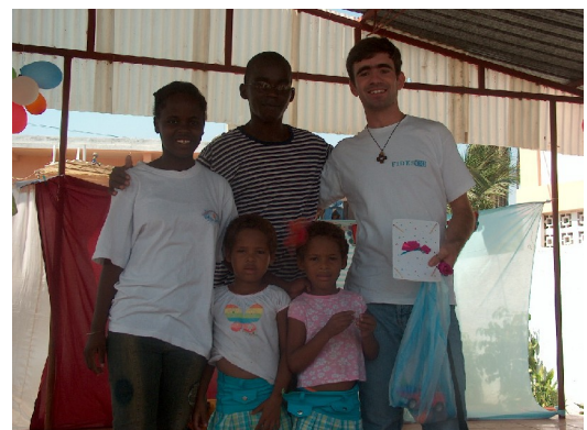
Le travail dans le Centre est rempli de joie

Le 16 de Juin, journée des enfants Africains, a été congé pour certaines écoles. Les professeurs et les jeunes du centre, ont organisé une fête. Je suis resté le matin avec eux, pour jouer et partager nos joies avec les enfants. D'une manière générale, le travail dans le centre de Mama Muxima est assez gratifiant. C'est différent du travail dans l'Université; dans le centre on partage beaucoup plus la vie des personnes, soit des jeunes, des enfants, des fonctionnaires ou des sœurs. Nous sommes ensemble, en vivant les mêmes expériences. Bien que ce soit seulement trois jours, on peut entrer dans le cœur de tous. Même s'il y a des difficultés en relation à