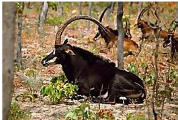
Palanca negra gigante

Encore une fois je me réjouis de pouvoir partager avec vous cette mission en Angola. Depuis le dernier rapport, envoyé en Avril, le temps est passé très rapidement. Ces trois mois ont galopé de façon incroyable. Depuis le dernier rapport, certaines choses ont été modifiées, d'autres se maintiennent, mais la joie de pouvoir vivre cette expérience reste la même. Grâce à Dieu, à la prière de tous, et principalement la vôtre, je me sens très confiant pour continuer. Je remercie aussi tout ceux qui au long de ces trois mois m'ont écrit des paroles d'encouragement, bien que je remercie aussi immensément tout ceux qui me soutiennent financièrement. Comme promis je continue à présenter au Seigneur vos intentions, ainsi que pour ceux qui vous sont chers. De cette forme je vais partager un peu le travail effectué jusqu'à ici, l'adaptation à l'ambiance, les nouvelles expériences et mon évolution. Dès maintenant je rends grâce au Seigneur, pour tout ce qu'Il m'a révélé ici. Il connaît mes difficultés et mes limites, mais jamais je me suis senti abandonné de Lui. Sa miséricorde est infinie, et je lui chante mon hymne d'action de grâces.