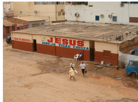
Lieu de rencontre de la secte qui se trouve en face de notre immeuble

En face de notre immeuble se trouve une secte qui chante tout les matins très tôt. Cela m'a aidé à prendre le bon rythme rapidement : difficile pour moi au début de rester au lit après 6 ou 7 heures du matin, puisque le soleil se lève toute l'année vers 6h30 et à partir de 8h il tape déjà fort. Il m'a fallu plusieurs semaines pour m'adapter à la chaleur. Mais que ceux qui croient que