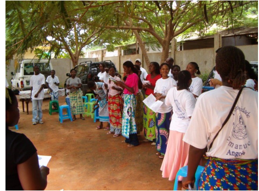
Louange avec la Communauté de l'Emmanuel

En relation aux activités extra que je réalise, une bonne partie d'entre elles sont reliées à la Communauté de l'Emmanuel en Angola, par exemple la veillée du vendredi saint, ou la vigile pascale. Pendant le mois du Sacré Cœur de Jésus (en Juin), j'ai participé à la neuvaine et aussi à la vigile du 22 au 23, au sanctuaire du « Sacré Cœur de Jésus » animé par les sœurs Clarisse de Luanda. Beaucoup de personnes sont restées toute la nuit pour prier et louer le Cœur de Jésus. Dans ce petit sanctuaire, beaucoup de personnes vont quotidiennement prier, faire des promesses, ou même parler avec une des sœurs. De temps en temps, notre communauté organise, ensemble avec les sœurs, quelques activités.