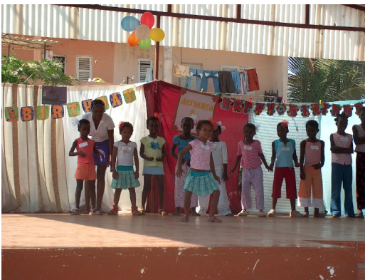
Fête internationale des l'enfants