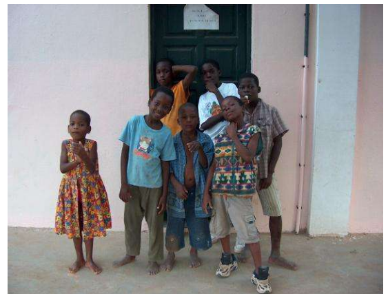
Enfants du Centre Sainte Barbara