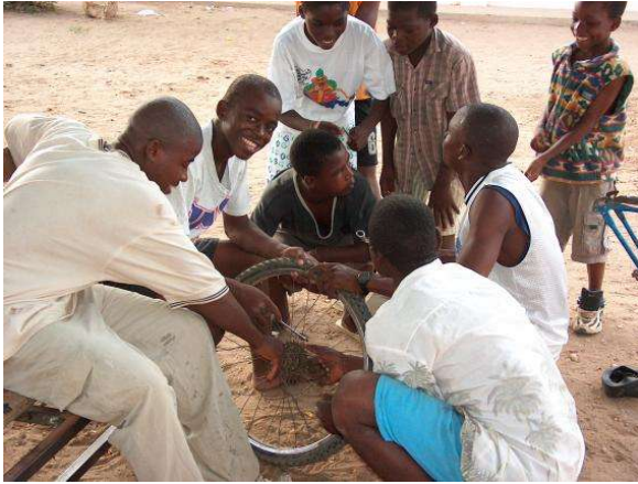
La joie toujours présente

Ces premiers jours en Angola m'ont permis de découvrir un immense trésor culturel et spirituel. Partout où je passais, j'étais très bien reçu. Les personnes ici ont un très grand sens de l'accueil et aussi tous gardent dans leur coeur un lieu tout particulier pour les missionnaires. Malgré les difficultés relatives à la culture, la distance des parents et amis, ce passage pour l'Angola est en train d'être pour moi un grand moment d'action de grâces.