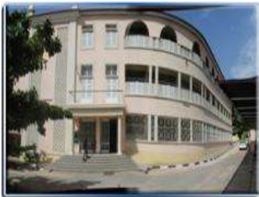
Universidade Católica de Angola