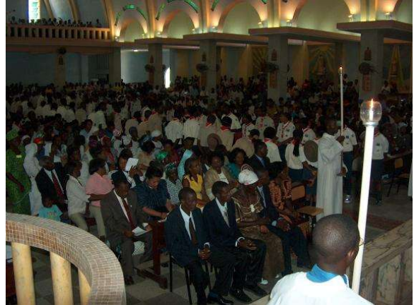
Active et nombreuse participation dans les messes

Cardinal Dom Alexandre do Nascimento. Le diocèse recouvre la capitale et trois villes voisines, avec une population de 5,5 millions de personnes. À Luanda il y a 30 paroisses et quelques missions religieuses. De ces paroisses la plupart sont tenues par des prêtres qui appartiennent à des congrégations. Le diocèse possède 10 prêtres. Dans le séminaire il y a 200 séminaristes, parmi ces 200, 100 sont au séminaire mineur et propédeutique et les autres au séminaire majeur. Le peuple angolais se distingue par sa forte pratique religieuse. En effet, la participation aux sacrements, en particulier l'Eucharistie, est très forte. Ils célèbrent leur foi avec des chants et danses qui nous contaminent et nous font comprendre l'importance de l'inculturation. La participation des jeunes dans les activités d'Église attire beaucoup notre attention, car malgré les difficultés, l'Église d'Angola a beaucoup à enseigner à l'Église du Monde.