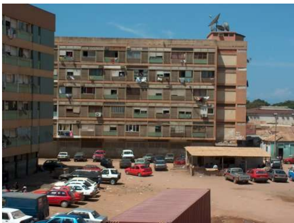
Place Deolinda Rodrigues