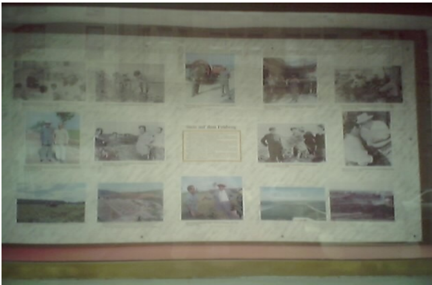
Eine Schautafel über den Präsidenten Nordkoreas.