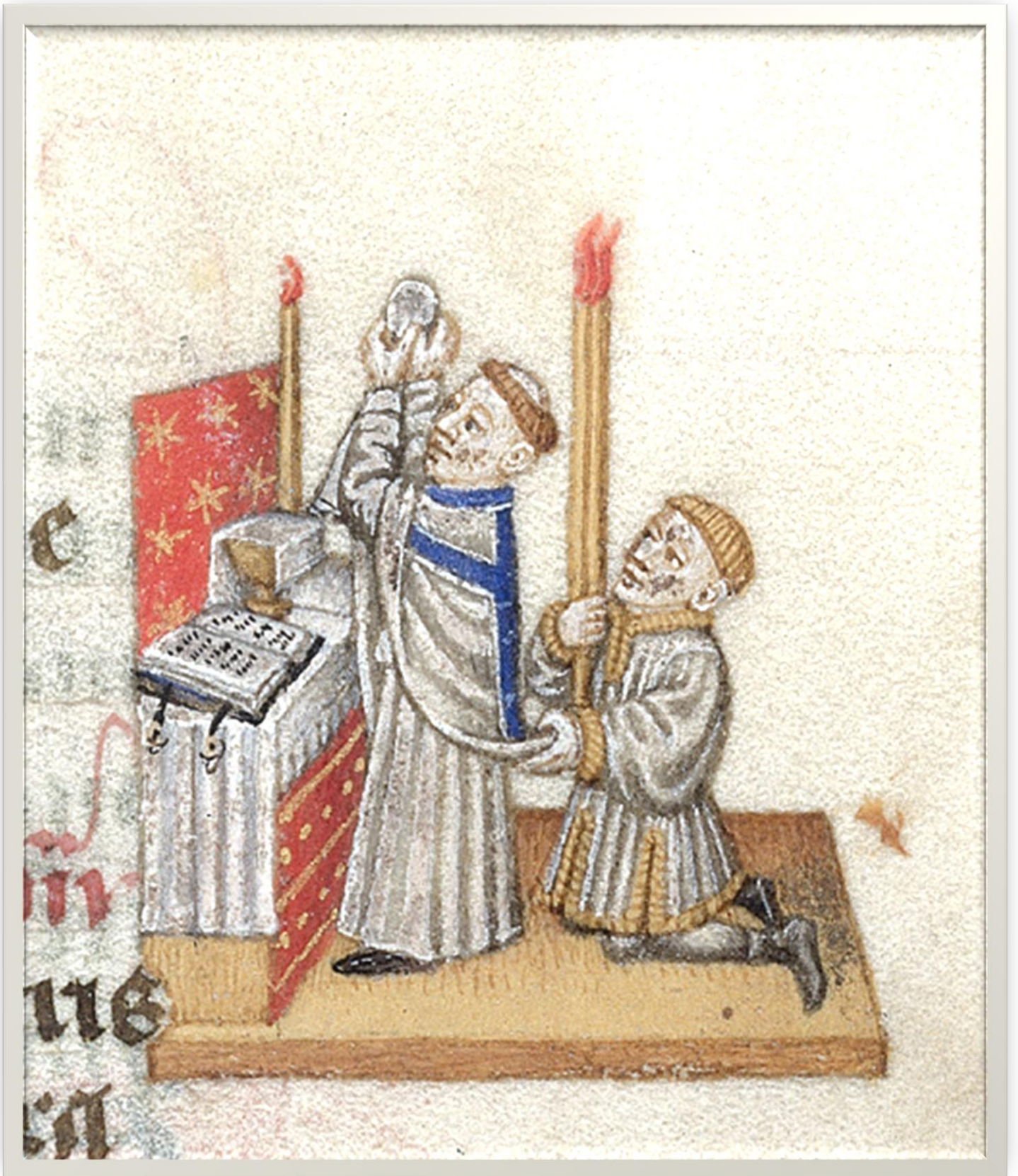
ORDO MISSAE CUM POPULO