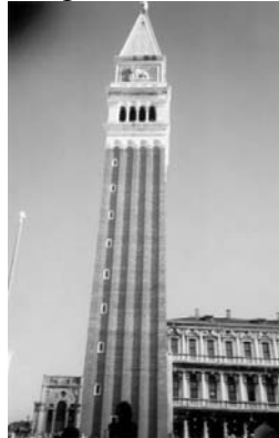
Torre del Campanario (Pza. San Marcos)