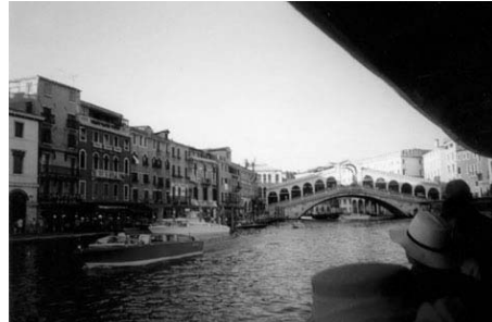
Puesto de Rialto

Os aconsejo caminar sin rumbo fijo por las callejuelas laberínticas e inigualablemente estrechas, cruzando uno tras otro los puentes sobre los canales, y disfrutar de las gentes de la ciudad, pueblo otrora comerciante y viajero, ahora anfitrión sin igual para el visitante.