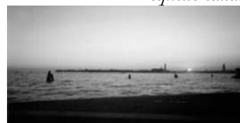
Atardecer en el puerto