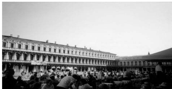
Piazza de San Marcos