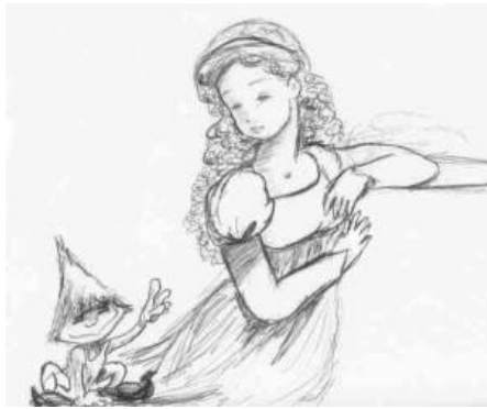
Ilustración Laura Oliver