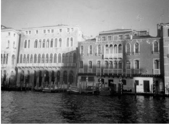
Vista de los Palacios desde el Vaporetto.