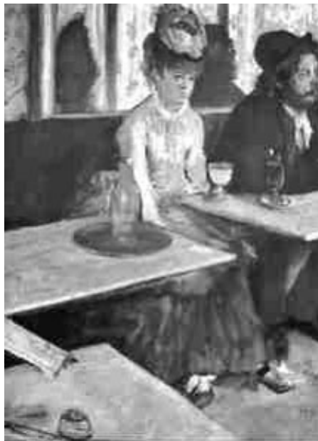
Los bebedores de ajeno o El ajeno -Edgar Degas, 1879-

-Le ruego que se marche, tengo que oficiar la misa y ya han dado la segunda señal. Que el Señor se apiade de tu alma, yo ya no puedo hacer más. Vete con Dios.