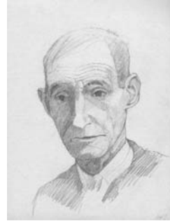
Ilustración Guillermo López

El sepulturero imagina vidas no vividas mientras entierra muertos ajenos.