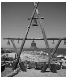
Casa de Neruda en Isla Negra

El concurrido balneario de inmensas playas que era Cartagena a finales del S.XIX es hoy una ciudad acogedora y somnolienta, donde reposan en una paz sobrecogedora los restos del audaz poeta Huidobro. En la relativa bonanza económica actual, la tierra donde vivieron algunas de las más interesantes culturas precolombinas, se va erigiendo como un destacado centro tecnológico y financiero de América Latina, aunque a las afueras de las grandes ciudades, junto a alguna urbanización, abundan las casas bajas de fachadas descascarilladas y tejados de chapa, donde se respira aún la humanidad de una alegre vida aldeana.