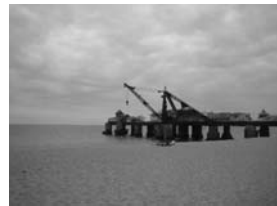
Antiguo puerto de Viña del Mar