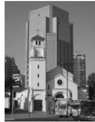
Barrio de Providencia (Santiago)