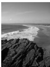
Playa de Cartagena