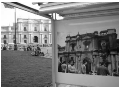
Palacio de la Moneda (1973 y 2005)