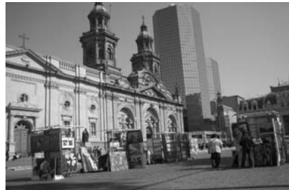
Catedral en la Plaza de Armas (Santiago)