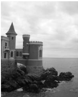
Viña del Mar