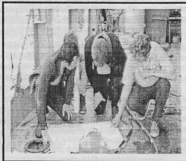
Socios de Pemex los corren

"cabar de tajo con los derechos consagrados en la Constitución"