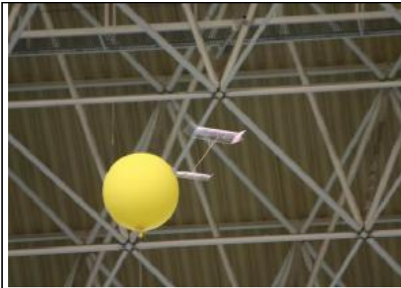
Dirección con ayuda de un globo