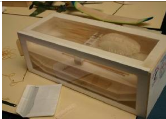
Pensando en la aduana