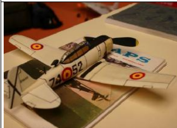
Texan de Jaume