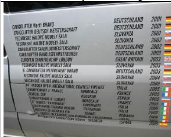
Furgoneta Checa "Tuneada"