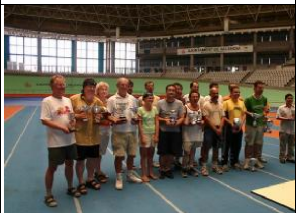
Foto de Grupo

La repercusión Internacional ha sido positiva, las excelentes condiciones del pabellón que han permitido realizar muy buenos