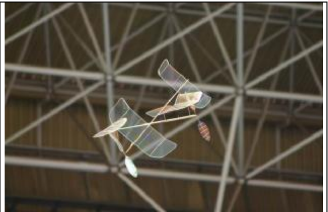
Colisión en el Aire