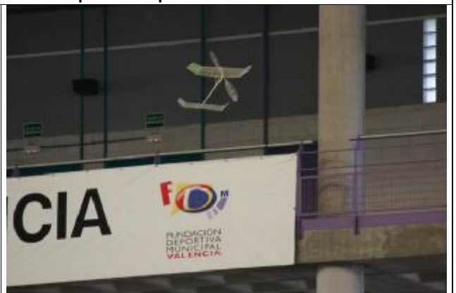
Se utilizaba toda la altura disponible