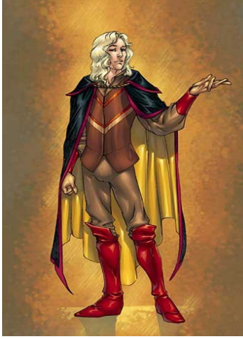
EL CABALLERO GALANTE

Caballero galante Mi corazón hipnotizaste Y ahora lo ocultaste Cuando me despertaste Tu corazón alteraste Y en medio de una noche De pasión el deseo invocaste