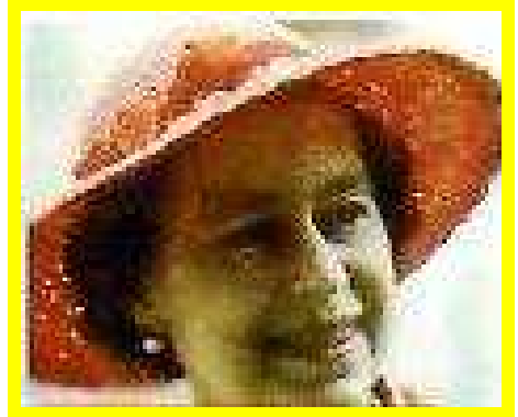
Reina Victoria, La Patroncita Escudo de la Patria Amada