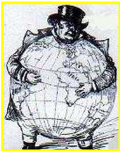
John Bull, regordete después de merendarse el planeta

Y bien mis queridos amigos y amigas: este asunto toca a su fin. Los ingleses, racistas de la primera hora, tuvieron, por aquel profeta que les escribió el Nuevo Génesis , don Charles Darwin , un serio problema. Ya vieron la forma en que lo resolvieron. No sé si será genial. Pero fue una solución.