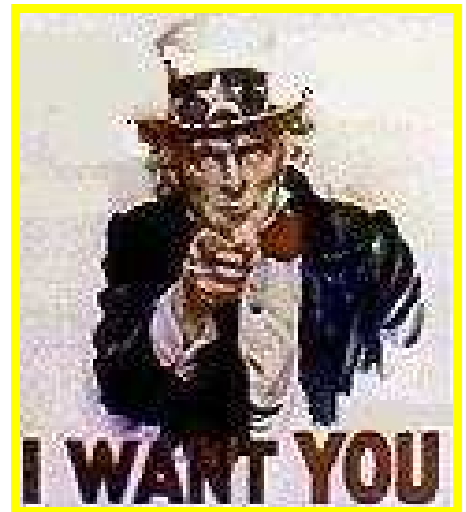
Tío Sam es más que un dibujito (1) es una picardía de los trololitas.