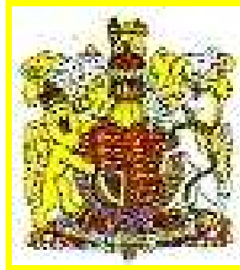
Escudo de la Patria Amada