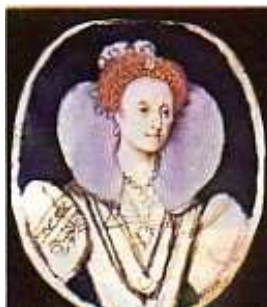
Isabel I Esta los parió a...

(LACRA EXTRANJERA, CATERVA ANTINACIONAL)