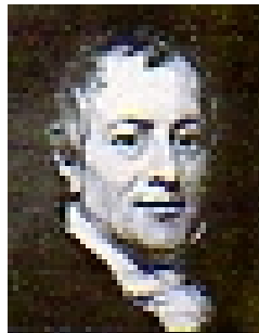
David Ricardo ... a este coso...