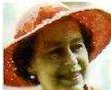
Isabel II ... y esta dio a luz...