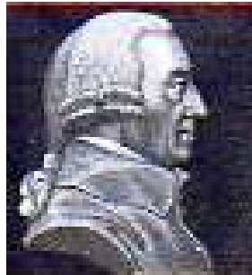
Adam Smith ... este y...