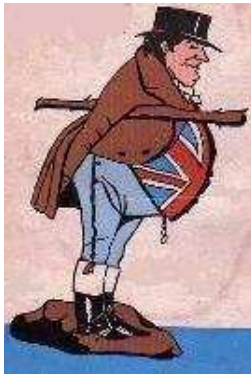
The Big Stick