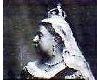
Reina Victoria ... y esta los parió...