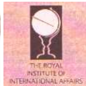
Escudo de la RIIA ... esto.