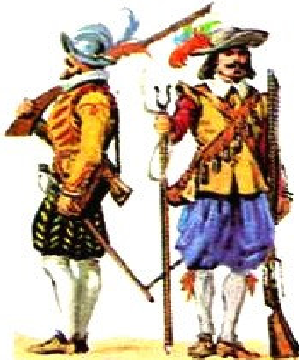
Arcabuceros españoles. Con ellos debió llegar desde Asunción el General Juan de Garay para fundar Santa Fe de Luyando.

(Santa Fe de Luyando no estuvo en Cayastá)