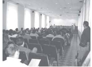
Encuentro de Delegados

El 28 de Febrero, día de Andalucía, a pesar de las condiciones climatológicas, hacía un viento y un frío de cojones, CGT se movilizó ante el Parlamento de Andalucía en contra de la privatización de los servicios públicos y la precariedad laboral en la Administración Pública. Allí estuvimos nosotros para denunciar las condiciones de trabajo en que nos encontramos los trabajadores de Egmasa.