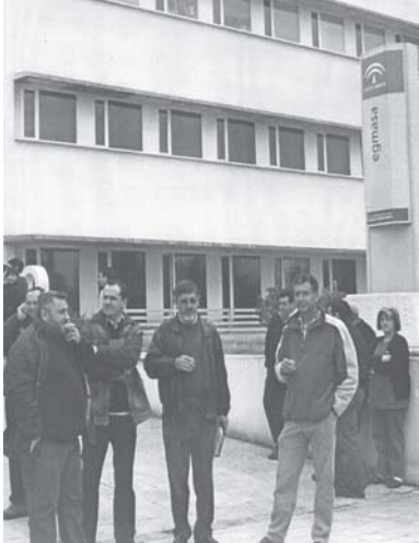
Reunión en Egmasa con el Consejero Delegado

Volviendo a la reunión con la Consejería y para terminar, decir que se han quedado las puertas abiertas para que desde la CGT , se continúen planteando aquellas cuestiones y recomendaciones que nos afecten y decimos desde la CGT , pues a la Consejería no llega toda la información que debería llegar o llega a medias, y ya se sabe; no hay mentira más grave que una verdad a medias.