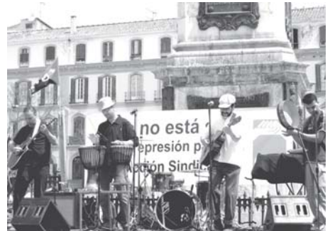
Celebración 1º de Mayo

Teniendo en cuenta lo anterior, no nos queda mas remedio que estar en esa negociación, pues si negocian los mismos, volveremos a ir de culo y cuesta abajo. Pero esto no es problema de la consejería, y sí de los trabajadores, los cuales debemos tomar el mando de este barco y acostumbrarnos a pedir responsabilidades a quienes negocian nuestro futuro.