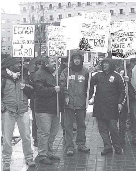
Manifestación por el Pleno Empleo el 28 F. Parlamento Andaluz.