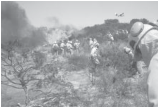
Foto realizada en Bobadilla en la obras del AVE Córdoba-Málaga Foto ganadora en el concurso realizado en el CDF de Colmenar de 2003.

La Consejera de Medio Ambiente SI , alquilándonos helicópteros con los sillones atados con alambres. «...de esta forma mis muchachos y mis muchachas mientras que piensan en los sillones con alambres no lo hacen de la precariedad laboral, los bajos salarios, etc, cuestiones desagradables que afean el cutis de mis trabajadores...», declaraciones de Fuensanta Coves a esta redacción.