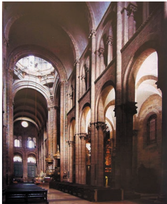
Lámina 2 (hasta 4 puntos). / Lámina 2 (ata 4 puntos).

Señala sus características formales (hasta 1 punto). / Sinala as suas características formais (ata 1 punto).