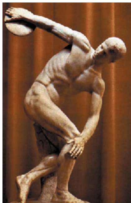
Lámina 2 (hasta 4 puntos) / Lámina 2 (ata 4 puntos)

Realiza un estudio formal de la obra incidiendo en su concepción espacial (hasta 2 puntos). / Realiza un estudio formal da obra incidindo na súa concepción espacial (ata 2 puntos).