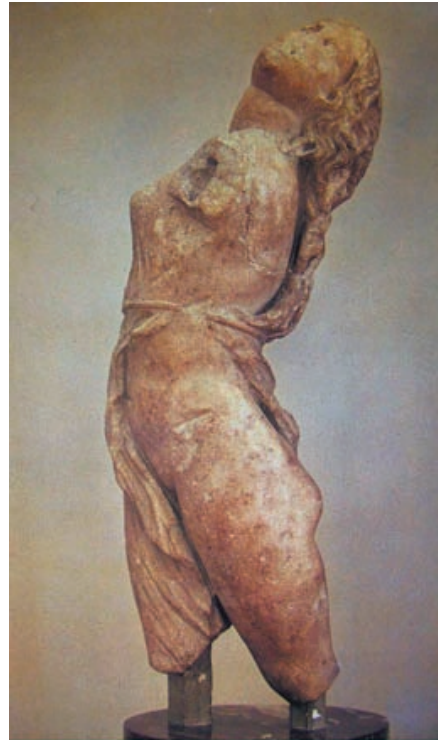
Lámina 2 (hasta 4 puntos). / Lámina 2 (ata 4 puntos).

Realiza un estudio iconográfico y formal de la obra incidiendo en su concepción espacial (hasta 2 puntos). / Realiza un estudio iconográfico e formal da obra incidindo na súa concepción espacial (ata 2 puntos).