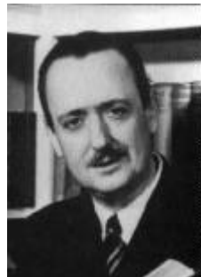
Jonh Dickson Carr

puesto, aficionado a resolver problemas imposibles. Buenhumorado siempre como todos los personajes creados por un autor que vivió feliz, Fell es también, al contrario que bastan-