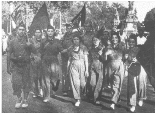
Anarchosyndikalistische MilizionärInnen 1936

Er betonte, weniger von der Vergangenheit reden zu wollen, da die heutigen Verhältnisse sich grundlegend geändert hätten. Das