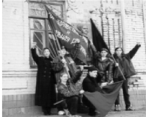
Bei einer Gedenkveranstaltung der RKAS vor dem Geburtshaus Machnos

Der Autor versteht es sehr gut, Fiktion und Überlieferung miteinander zu kombinieren. Dabei kommt er ganz ohne Mythen aus, welche sich gerade in Anbetracht einer „heldenhaften“ Befreiungsbewegung wie der Machnowtschina rasch verbreiteten. Dementsprechend sind auch die Personen durchaus als gemischte Charaktere dargestellt worden. Mutige Kämpfer weinen hier auch mal. Nestor Machno, der Anführer der Bewegung wird mit besoffenem Kopf auch mal zudringlich und von einer Frau abgewiesen. Deutlich wird nicht nur an diesem letzten Beispiel nachgezeigt, wie lang anhaltende Kämpfe auch auf solidarische Befreiungskämpfer verrohend wirken können.