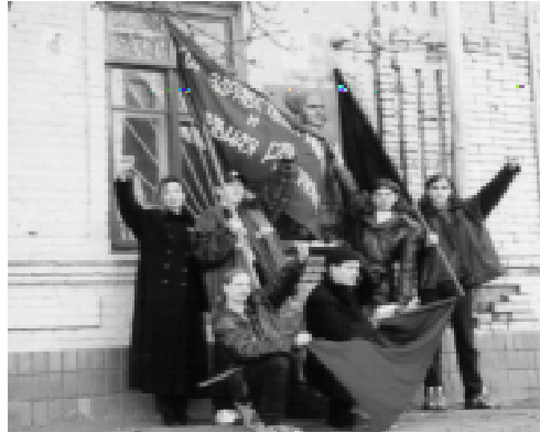
Bei einer Gedenkveranstaltung der RKAS vor dem Geburtshaus Machnos

Der Autor versteht es sehr gut, Fiktion und Überlieferung miteinander zu kombinieren. Dabei kommt er ganz ohne Mythen aus, welche sich gerade in Anbetracht einer „heldenhaften“ Befreiungsbewegung wie der Machnowtschina rasch verbreiteten. Dementsprechend sind auch die Personen durchaus als gemischte Charaktere dargestellt worden. Mutige Kämpfer weinen hier auch mal. Nestor Machno, der Anführer der Bewegung wird mit besoffenem Kopf auch mal zudringlich und von einer Frau abgewiesen. Deutlich wird nicht nur an diesem letzten Beispiel nachgezeigt, wie lang anhaltende Kämpfe auch auf solidarische Befreiungskämpfer verrohend wirken können.