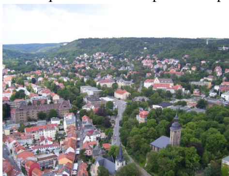
Figura 2: Foto de Jena feta per mi des de la torre Intershops.