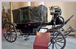
Durante la invasión francesa, en este carruaje Benito Juárez viajó de ida y vuelta de la Ciudad de México a Paso del Norte (hoy Ciudad Juárez).