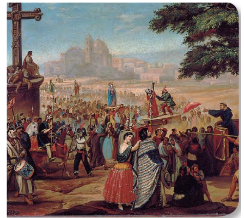
Figura 1.48 Independientemente de las Leyes de Reforma, la religiosidad popular católica continuó practicándose públicamente en todo el país, como las procesiones. Semana Santa en Cuautitlán, Primitivo Miranda (1858).