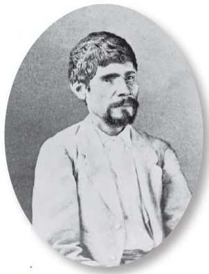
Figura 1.47 Manuel Lozada, el Tigre de Álica, dirigió en 1873 una rebelión contra la desaparición de la propiedad comunal, promulgada en las Leyes de Reforma. Manuel Lozada (1850-1873).