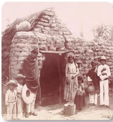
Figura 1.46 La pobreza extrema también fue motivo para los fotógrafos del siglo XIX. Casa de adobe en León, Guanajuato, Mayo y Weed (1898).