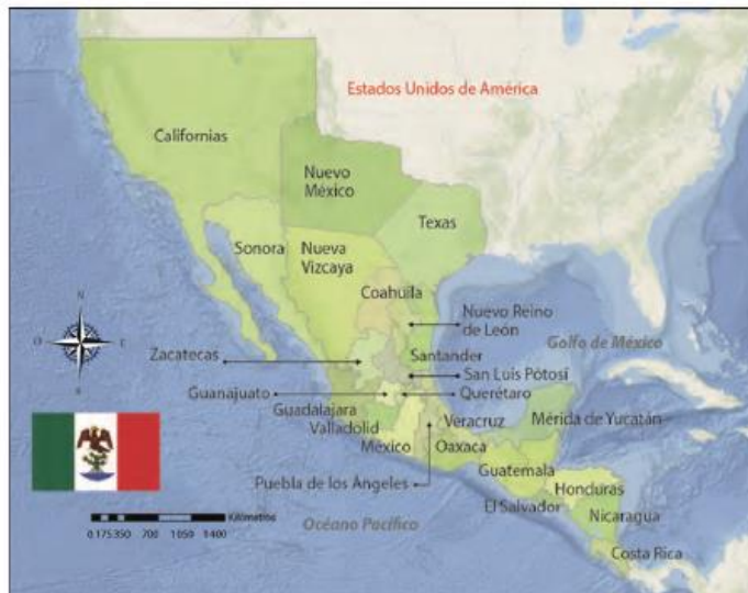
Mapa 1.1 Imperio mexicano (1821-1823)

SEP (2019), Historia. Telesecundaria. Tercer grado