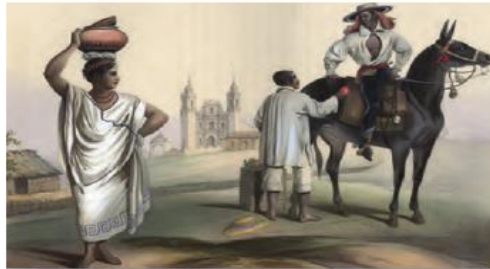
SEP (2020), Historia. Telesecundaria. Tercer grado