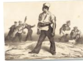
Libertad de prensa, obra del artista francés Honoré Daumier, representa a un hombre que expresa valentía y seguridad para defender su libertad de expresión.

La elaboración, aprobación y publicación de leyes es el primer paso para hacer efectivo el derecho a la libertad. También se requiere un régimen de gobierno con instituciones sólidas a las que las personas puedan acudir en caso de que sus libertades fundamentales sean violentadas.