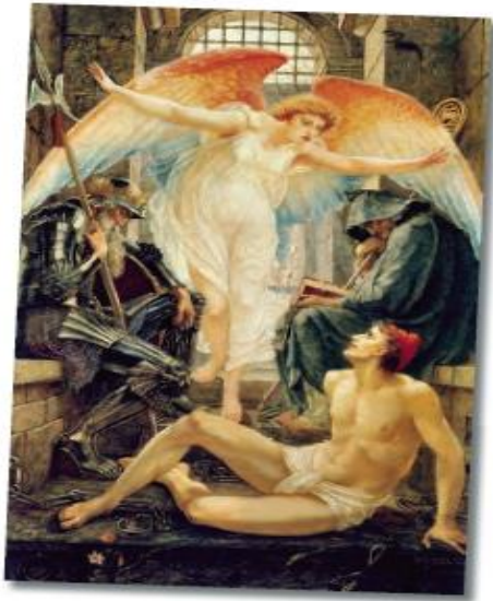
El concepto de libertad frecuentemente se representa como una mujer con la mano derecha en alto o con alas. En la obra La Libertad , de Walter Crane, aparece ante un hombre que se encuentra preso.

Comienza a reflexionar acerca de los temas de esta secuencia con las siguientes preguntas: