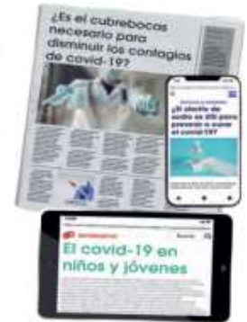
SEP, Lengua Materna. Español. Telesecundaria. Tercer grado Vol. 2, México, 2020, pág. 33

5. Con el tema que elegiste, llena de manera similar un cuadro con la descripción, planteamiento y preguntas que permitan reconocer la polémica. Por el momento puedes escribir lo que sabes, piensas y sientes; pero una vez hecha la investigación, retomarás este cuadro para complementar el planteamiento. Este cuadro es el Producto 2 de la Carpeta de Experiencias .