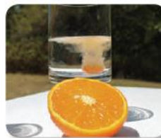
Figura 1.22 Una tableta de vitamina C contiene al menos tres ingredientes: ácido ascórbico, citrato de zinc y colorante.

Algunos alimentos y medicinas, como la gelatina o el jarabe para la tos, son sustancias hechas con más de un ingrediente (figura 1.22). Al combinarse dos o más sustancias o materiales se forma una mezcla .