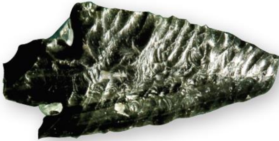
Figura 1.19 La obsidiana es un tipo de roca volcánica de color negro, aunque puede ser verde o café si tiene algunas impurezas. Cuando se quiebra, produce esquinas muy afiladas.

Hoy en día, no sólo se investigan las propiedades de diferentes materiales con el fin de aprovecharlos al máximo sino que, gracias al conocimiento científico, también se diseñan algunos otros para que posean propiedades de interés.