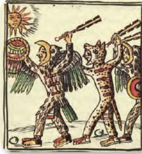
Figura 1.18 El macuahuitl estaba formado por seis u ocho piezas de obsidiana afilada incrustadas en un palo que medía de 60 a 80 cm.

El uso idóneo de un material está asociado con el conocimiento de las propiedades que posee. Una parte del desarrollo de las civilizaciones está ligada a la adquisición y el dominio de este conocimiento. En el proceso de conquista de los pueblos americanos, por ejemplo, el uso de los metales y la pólvora, por parte de los españoles, impuso una diferencia notable entre las dos culturas.