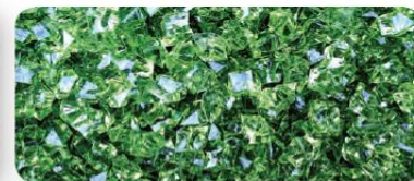
Figura 1.15 El valor comercial del diamante es mayor que el del vidrio. ¿Te imaginas que te regalen un vidrio en lugar de un diamante?