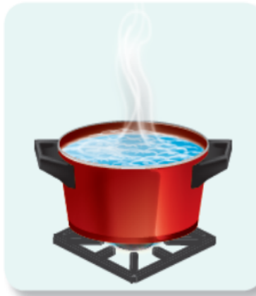
Figura 1.39 La temperatura que se alcanza con la misma cantidad de calor en un sistema cerrado, como la olla exprés, es mayor en comparación con la que se alcanza en uno abierto.

Esta actividad se encuentra en la página 53-54 de tu libro