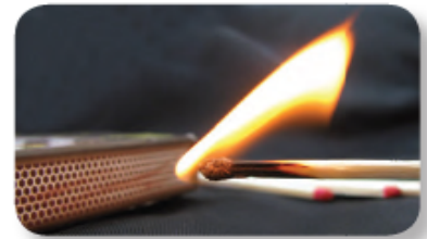
Figura 1.9 Para evitar la ignición accidental, los cerillos de seguridad tienen el fósforo en un costado de la caja y no en la cabeza del cerillo.

Al exponer un trozo de madera al fuego se produce un cambio: se quema. Al final, quedan cenizas y algunos gases, sustancias diferentes a la inicial. A este tipo de fenómenos que producen nuevas sustancias se les conoce como cambios químicos . Las sustancias producidas tienen propiedades diferentes a las de las sustancias de las que se derivan, en este caso: la ceniza es un fino polvo blanco, mientras que la madera, un material sólido y de color pardo. Ahora, si expones la ceniza al fuego, ésta no responderá de la misma forma que la madera, pues no se quemará con facilidad. A estas propiedades, que se observan debido a un cambio químico, se les llama propiedades químicas . A continuación, conocerás con detalle dos ejemplos: inflamabilidad y corrosión.