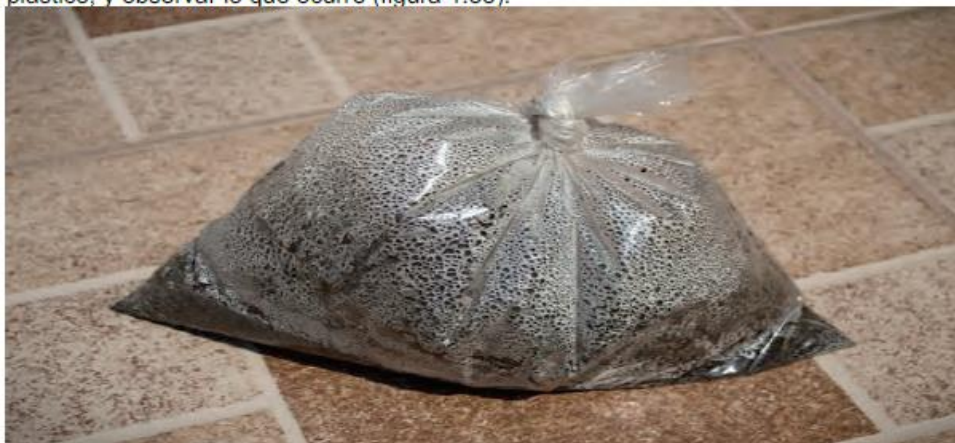
Figura 1.38 Si se deja al sol, el lodo permanece más tiempo húmedo dentro de una bolsa que fuera de ella, esto es evidente debido a las gotitas de agua que se forman dentro del plástico.

El correcto análisis de los fenómenos es importante para comprender los diferentes cambios físicos y químicos. De esta forma, se puede conocer con precisión el antes y el después de un proceso. Por ejemplo, ¿qué pasará con el agua contenida en una bola de lodo, después de ponerla al sol? Para saberlo, podría colocarse la bola dentro de una bolsa de plástico, y observar lo que ocurre (figura 1.38).