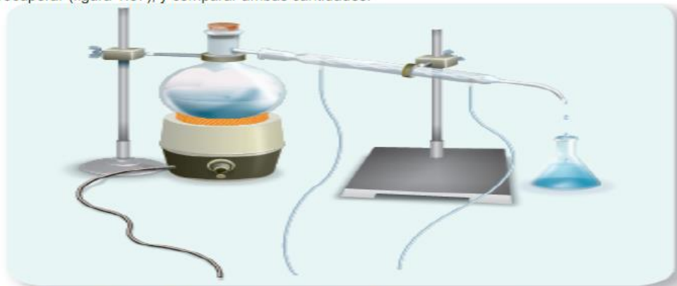
Figura 1.37 Este dispositivo de destilación es usado por los científicos para recuperar el vapor que genera la ebullición de un líquido. El vapor es conducido a través de un tubo condensador.

Como ya se mencionó, cuando el agua hierve, el vapor generado escapa al exterior. A pesar de esto, el agua no deja de ser agua, no deja de existir ni se transforma en otra sustancia, simplemente cambia de estado sin que su composición ni su masa se alteren. Para comprobar que la masa de agua es igual a la masa de vapor formado, éste se podría recuperar (figura 1.37), y comparar ambas cantidades.