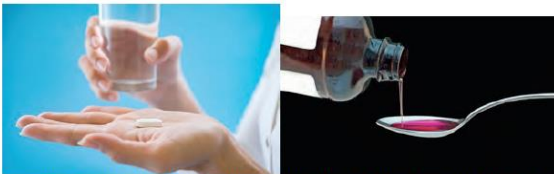
Figura 2.16 Las reacciones en fase sólida son más lentas, por eso los medicamentos sólidos y secos caducan después que los que están en disolución acuosa.

Considera la formación de agua a partir de oxígeno e hidrógeno, la cual se representa de la siguiente manera: