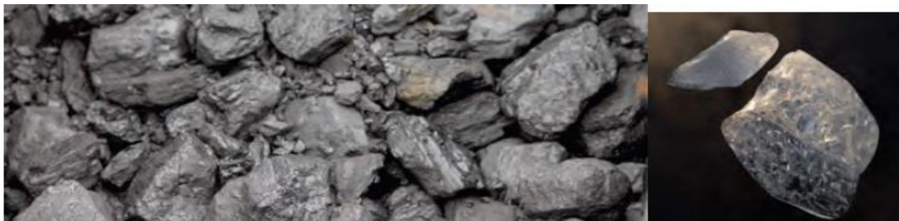
Figura 2.15 Para que el carbón se transforme en diamante es necesario someterlo a altas presiones y temperaturas.

La rapidez de una reacción depende de varios factores, por ejemplo, el estado de agregación. Así, las reacciones entre sólidos son lentas (figura 2.15), las reacciones entre líquidos tienen una rapidez media (figura 2.16) y las reacciones entre gases son más rápidas.