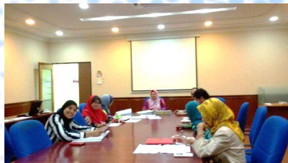
Suasana audit fail kursus di Fakulti Pengurusan Maklumat