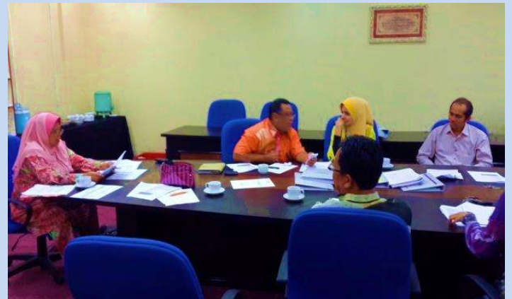
Mesyuarat Persediaan Audit pada 22 Januari 2015