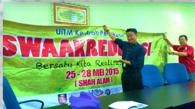
Persediaan Menghadapi Audit Swaakreditasi 2015