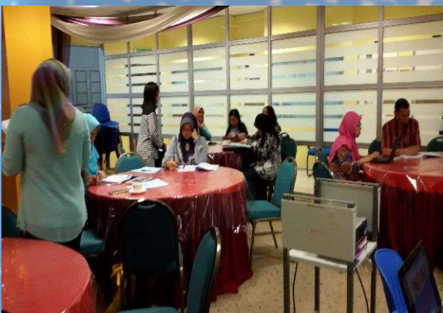
Suasana semasa bengkel “Groom to Bloom Series”