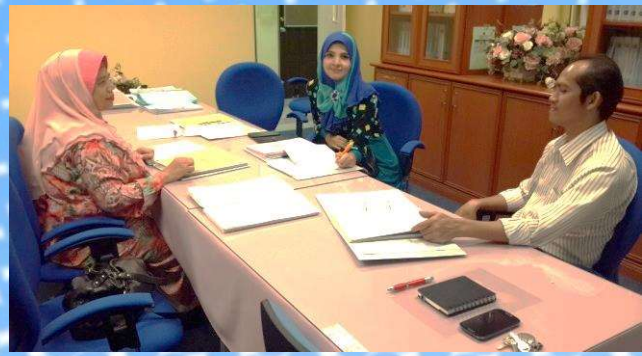
Perbincangan dan pemeriksaan fail pengajaran dan pembelajaran serta fail-fail prosedur operasi fakulti oleh Pasukan Audit Dalam di Bilik ISO, FPM pada 5 Februari 2015