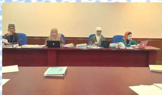
Proses audit fail pengajaran dan pembelajaran bagi semua program Fakulti Pengurusan Maklumat pada 9 Februari 2015