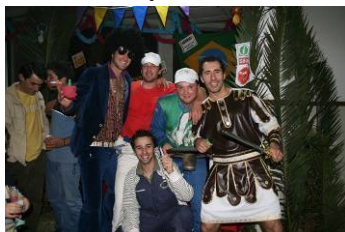
O Carnaval em Aruil