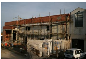
A Remodelação da nossa Sede