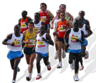
Aruil fez-se presente na Minimaraton Vodafone

Se participar nalgum evento, envie-nos a sua história e fotografias. Queremos divulgar o que a nossa gente faz. À semelhança do que se está a fazer aqui com a Minimaraton Vodafone.