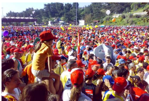
Visão geral da partida

Realizou-se no Domingo, dia 18.03.2007, pelas 10:30 a Minimaraton Vodafone. O percurso