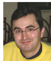
Presidente da Mesa da Assembleia-Geral

Sociedade Recreativa e Desportiva Aruilense Largo do Rossio, 1 - Aruil 2715-407 ALMARGEM DO BISPO