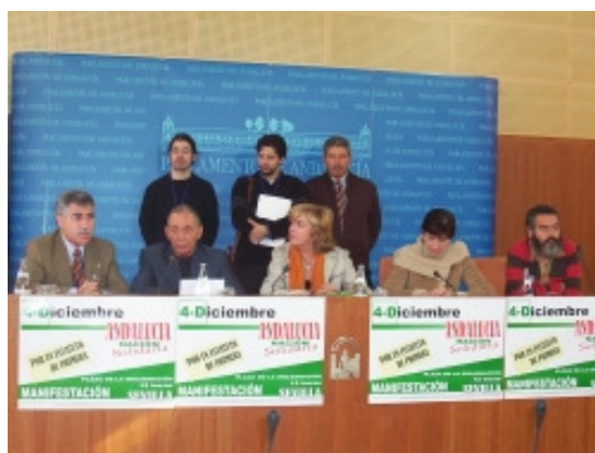
Presentación de la manifestación