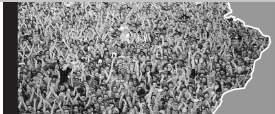
O povo de uma nação menosprezada! Mudaremos o Brasil quando começarmos a investir em atitudes patriotas.

Brasileiros esclarecidos sabem que temos muitas razões para resgatar nossas raízes culturais. Os dados apresentados ao lado podem