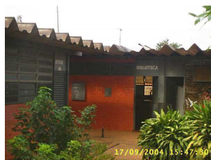
APAM & Biblioteca