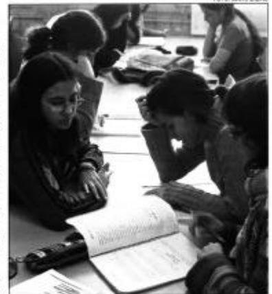
Classe a l'IES Lluís Vives