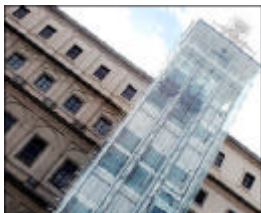
Ascensors al Centre d'Art Reina Sofia de Madrid (deuen respectar el patrimoni artístic, oi?)

La Generalitat se'ns rifa, es passen la pilota els uns als altres i les obres segueixen destrossant el Vives