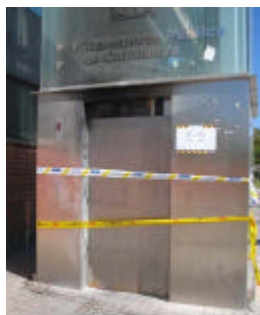
Ascensor a la via pública, fora de servei per bretolades

La Generalitat se'ns rifa, es passen la pilota els uns als altres i les obres segueixen destrossant el Vives