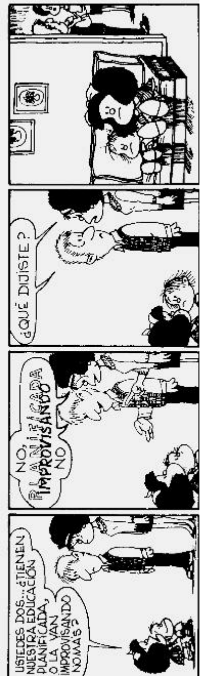
(c) QUINO (no li hem demanat permís, però estem segurs que ens el donaria)

Bé, encara que potser algunes de les coses que van sortir ens poden semblar ideals, difícils de posar en pràctica, si fem un xic de revisió del nostre comportament envers els fills, segur que comprovarem que moltes de les coses que van sortir a la xerrada conviuen amb nosaltres cada dia. I així ho vam poder constatar en l'estona que durà la xerrada. En definitiva, es tractava de compartir inquietuds, expectatives, maneres de fer, satisfaccions, i saber que no ens trobem sols, perquè si bé som singulars (els fills i els pares), no vivim en societats o grups aïllats i compartim molts espais i experiències.