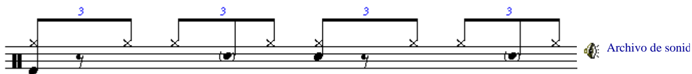
Figura 5. Ritmo de Shuffle a medio tiempo.

En la Figura 5 se muestra otro ritmo de shuffle en medio tiempo, pero en este caso se agregan unos golpes de tarola muy suaves "ghost" en el tiempo dos y cuatro.