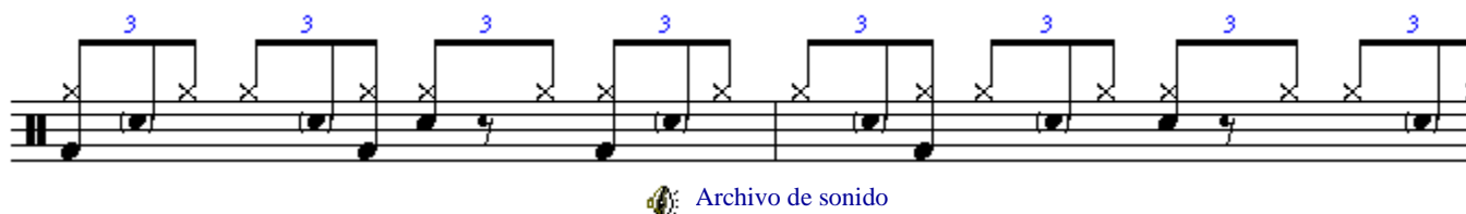
Figura 6. Ritmo de Shuffle a medio tiempo.

En la Figura 6 se muestra un ejemplo de shuffle mas elaborado, el cual forma parte de la canción Rosana del grupo Toto . Es importante memorizar y tocarlo lentamente al principio.