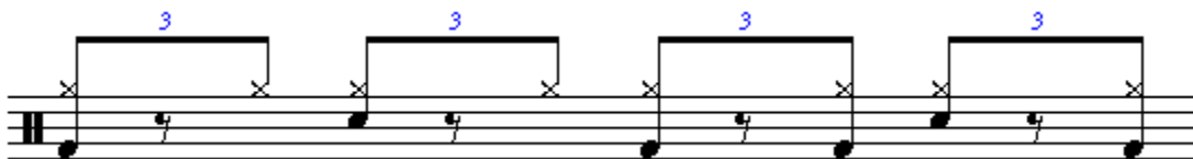
Figura 2. Ritmo de shuffle.

En la Figura 2 se muestra un ritmo parecido al de la Figura 1, pero en este caso se agregan golpes de bombo en los tiempos tres y cuatro. Lo interesante de este ritmo es cuando se toca de forma continua, es decir cuando se toca el golpe de bombo del tiempo cuatro y después el del tiempo uno.