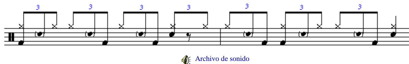
Figura 7. Ritmo de Shuffle a medio tiempo.

El la Figura 6 Se muestra una variante de shuffle, este ritmo es de la canción Chris and Kevin's Excellent Adventure del grupo Liquid Tension Experiment.