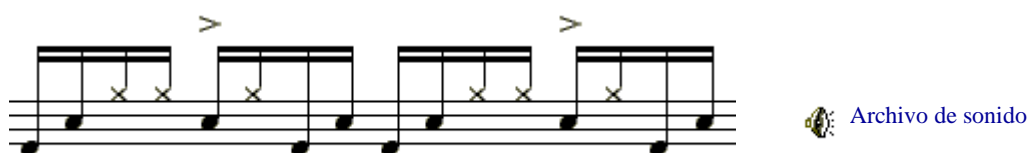
Figura 2. Compás lineal en cuatro cuartos.

Ahora observa el ritmo lineal de la Figura 2.