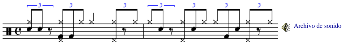
Figura 4. Ritmo de jazz.

A continuación se muestra un ritmo (Figura 4) del mismo estilo de la Figura 3, ya que contiene variaciones de tarola y bombo.