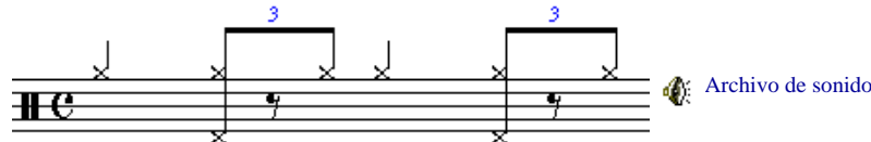
Figura 1. Patrón de jazz tradicional.

Esta lección es sólo una introducción al jazz, el mundo del jazz implica muchos estilos diferentes. En esta lección se estudiará el ritmo de jazz tradicional en el cual se utiliza el patrón de "swing" que se muestra en la Figura 1. Para una mejor comprensión de esta lección se recomienda tener un conocimiento básico de compases en cuatro-cuartos con tiempos en tresillo.