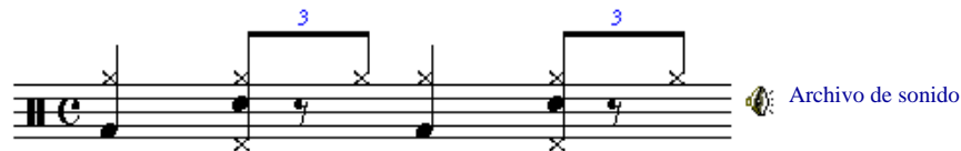
Figura 2. Ritmo de jazz tradicional.

Ahora para completar el ritmo se agrega el bombo y tarola de forma alternada en cada tiempo, de esta forma se obtiene uno de los ritmos de jazz tradicional más básicos como se muestra en la Figura 2.