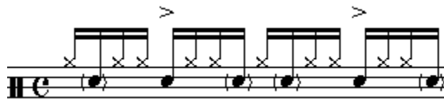
Figura 3. Acentúa en tiempos dos y cuatro.

Ahora se acentúa la tarola en los tiempos dos y cuatros, las notas restantes se tocan muy suave (Figura 3).