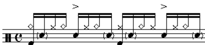
Figura 5. Ritmo con acentos en 3 y en 2.