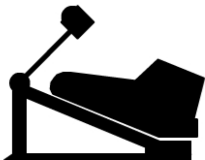
Figura 2 Talones abajo.

Te recomiendo que toque el bombo con los talones abajo (Figura 2), pero cuando lo domines y aumentes la velocidad tus pies no darán más, así que comienza a levantar un poco los talones para dar más fuerza a los golpes (subiendo y bajando las piernas) y también mas velocidad. La técnica de talones arriba (Figura 3) no es nada sencilla, lo más difícil es mantener el equilibrio, puedes experimentar variando la altura de tu banco, hasta que te sientas cómodo. Te llevara unas cuantas semanas dominar esta técnica.