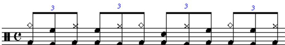
Figura 12. Ritmo con doble bombo y bembé con acentos.