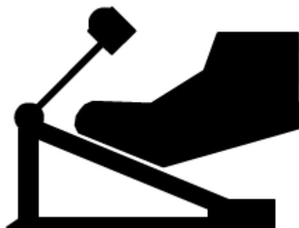
Figura 3 Talones Arriba

El ritmo de la Figura 4 es con bombo en dieciséisavos, observa como el ride y el bombo derecho marcan los cuartos. Observa que el patrón de bombos se repite cada cuarto; trata de comenzar muy, pero muy lento. El archivo de sonido está a una velocidad de 80.