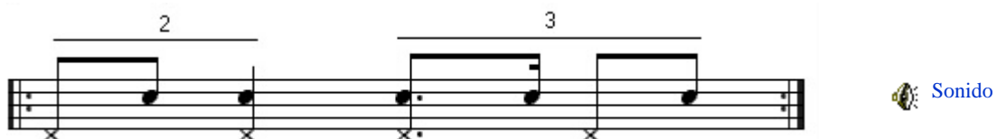
Figura 2 . Clave de Son 2-3.

Existen dos tipos de clave. Clave 2-3 y clave 3-2, a continuación se muestra la clave 2-3 (Figura 2) con conteo con el contratiempo de pie, trata de usar un metrónomo para llevar este tiempo, el archivo de sonido está grabado a 110. Te recomiendo que comiences a una velocidad de 80 o menor y la aumentes gradualmente.