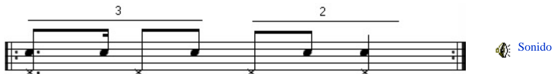
Figura 3 . Clave de Son 3-2.

Ahora en la Figura 3 se muestra la clave 3-2 con su respectivo conteo de tiempo.