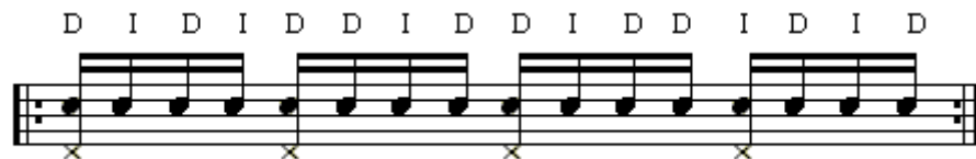
Figura 1. Patrón de ejercicio.

En la Figura 1 se muestra un patrón para ejercitar las manos y la mente para tocar la cascara. Al inicio no uses en contratiempo de pie, primero domina las manos a una velocidad 80 o menos hasta llegar a 100. Cuando domines las manos comienza a mover el pie.