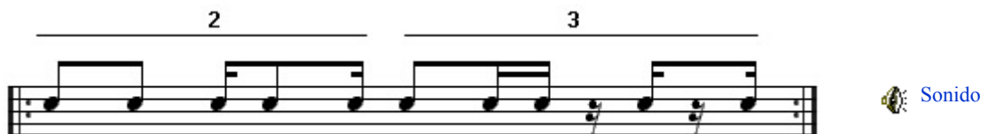
Figura 2. Cascara.

Observa la Figura 2, en la cual se muestra el patrón anterior pero sólo se toca la mano derecha, está es la cascara (o también cascara 2-3 como se indica en la Figura 2, la cascara 3-2 se toca a la inversa, primero el bloque 3 y después el bloque 2).