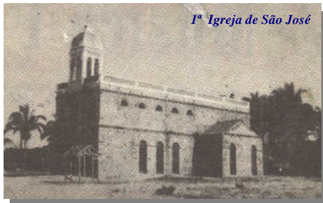
1ª Igreja de São José

Reorganizado o ensino público primário. As escolas de ensino público primário ficam classificadas em Escolas Mistas, escolas de primeiro grau, de segundo e terceiro.