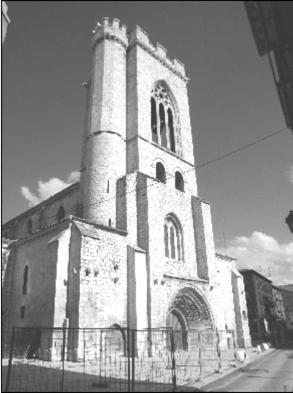
Imagen 8.- Iglesia de San Miguel en Palencia. En uno de sus altares se conmemoraba la victoria de Santa Clara en Tarifa.

a 22 de sus hombres a caballo y a 10 peones a coger ganado por los campos de Algeciras. Mala fortuna tuvieron, porque el adalid que los guiaba aunque cristiano, se encontraba confabulado con los moros de Algeciras. Llevó intencionada y sorpresivamente a la tropa cristiana cerca de la esta población, siendo por este motivo capturados todos los cristianos.