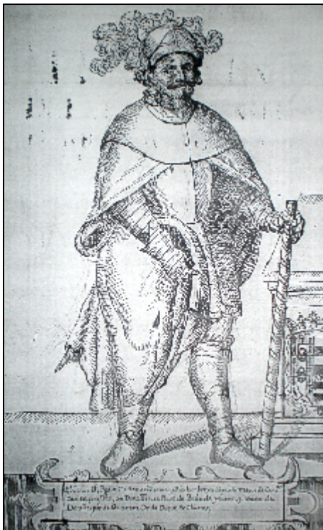
Imagen 3.- Pedro de Guzmán, adelantado mayor de Castilla y padre de Guzmán el Bueno. Dibujo del siglo XVI.

Guzmán tuvo amores con una leonesa de nombre Isabel de donde nació Guzmán el Bueno.