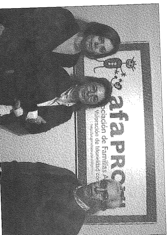
■ Miembros de Afaprovi en la sede de la asociación

Dado que la competencia de la adopción corresponde a la justicia, cuando se agota la vía auxiliar de la administración autonómica, los padres pueden presentar demanda contra la resolución de no idoneidad. "Lo curioso es que en la gran mayoría de casos que hemos tratado, los jueces han desestimado la resolución de la Consejería, acordando la idoneidad". "La valoración debería formar y asesorar a las parejas en la adopción"