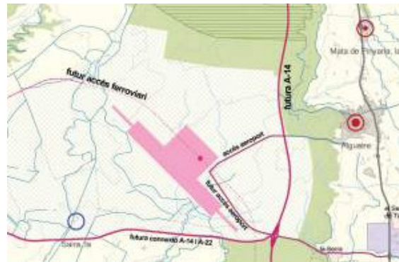
Gràfic de situació de l'aeroport i els accessos

Així doncs, el pla director també pren en consideració altres infraestructures que existeixen a l'entorn de l'aeroport o es preveuen construir en el futur. D'aquesta manera, el pla incorpora la integració de l'aeroport amb la xarxa viària mitjançant la seva connexió tant amb l'actual carretera N-230 com amb la traça de la futura autovia A-14, que ha de substituir-la funcionalment com a via ràpida de gran capacitat entre Lleida i l'Alt Pirineu i Aran.